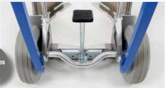
Roues increvables AIRLEX

L'accessoire d'aide au basculement réf. 117305 est idéal pour basculer votre diable sans effort lors de la manutention de charges lourdes (se fixe sur l'arrière de pelle standard type 1011039).