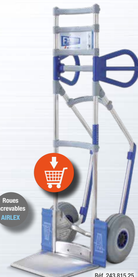
Réf. 243 815 25