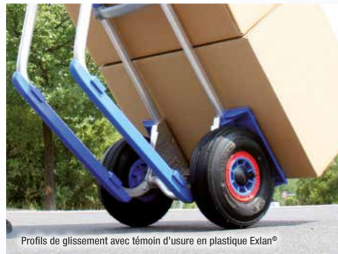
Profil de glissement avec témoin d'usure en plastique Exlan®