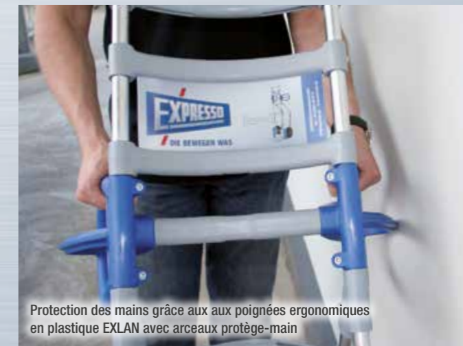
Protection des mains grâce aux aux poignées ergonomiques en plastique EXLAN avec arceaux protége-main