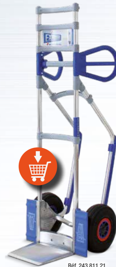
Réf. 243 811 21